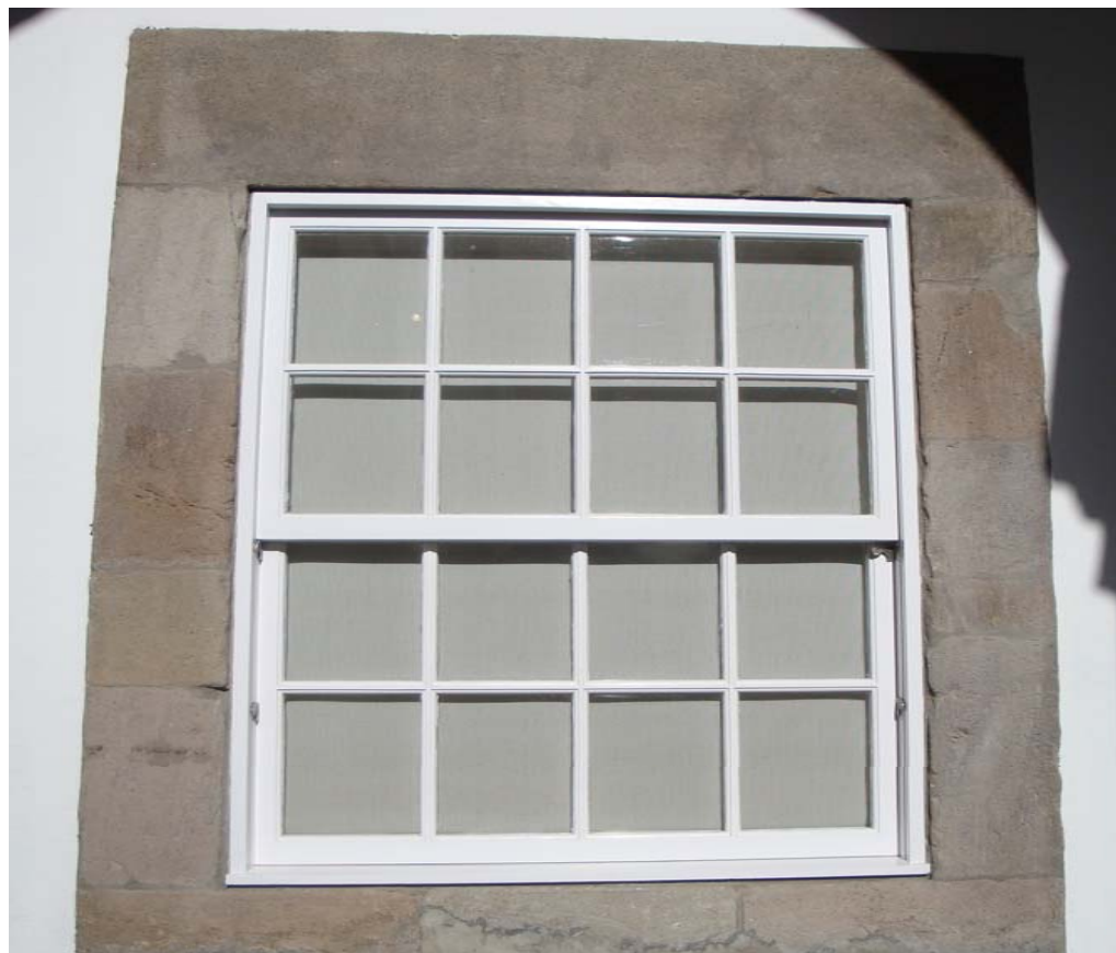
Janela do Museu – Angra do Heroísmo