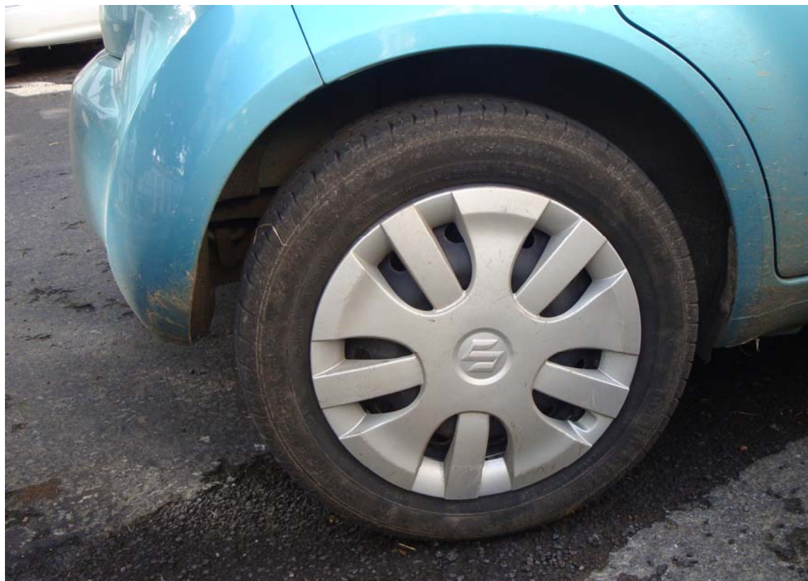
Parque de Estacionamento perto do Jardim – Angra do Heroísmo