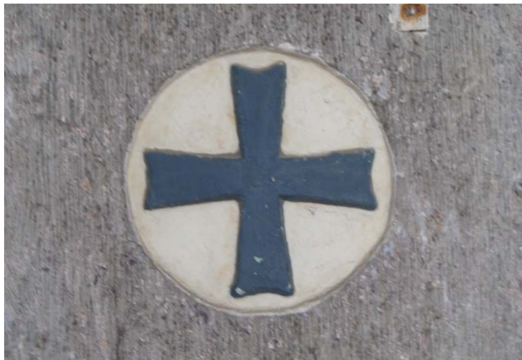
Entrada da Igreja da Sé – Angra do Heroísmo