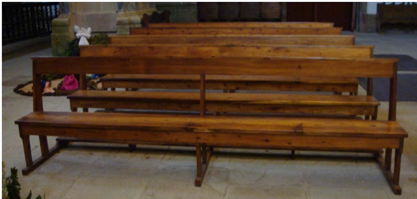
Banco da Igreja do Museu – Angra do Heroísmo D1 \rightarrow 360/1=360