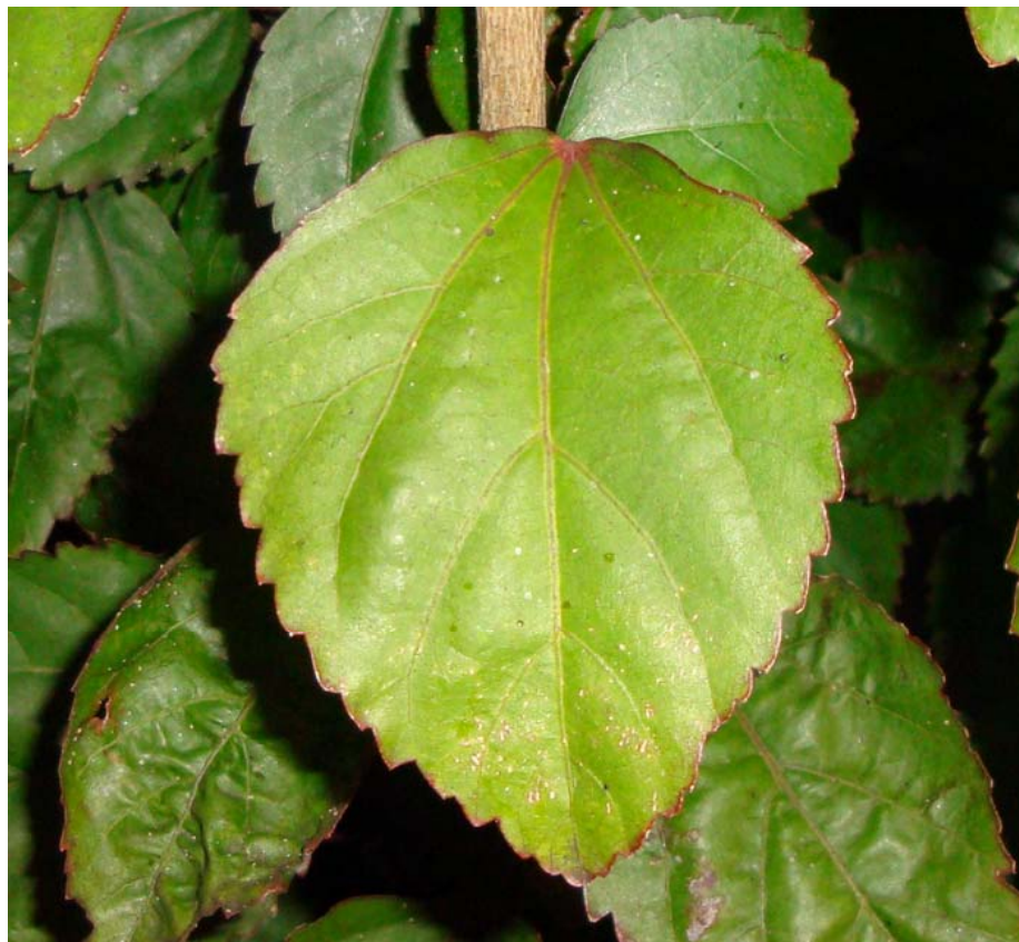
Jardim Duque de Bragança – Angra do Heroísmo