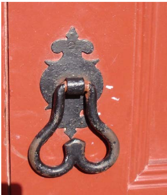
Mão de uma das portas do Museu – Angra do Heroísmo D1 \rightarrow 360/1 = 360