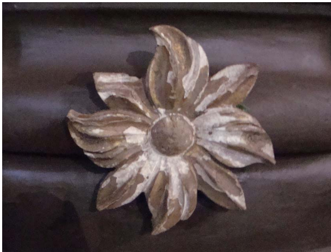
Igreja da Sé – Angra do Heroísmo