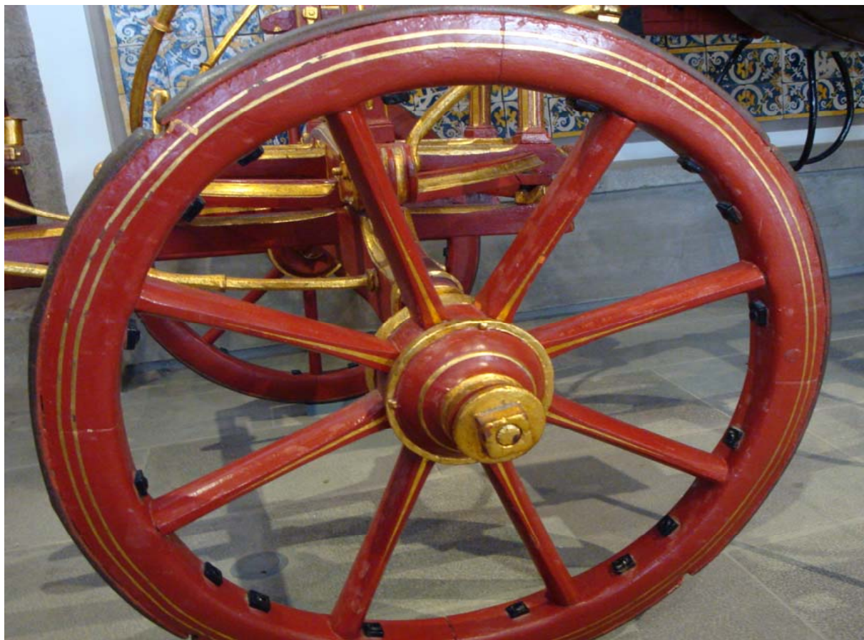
Museu de Angra do Heroísmo