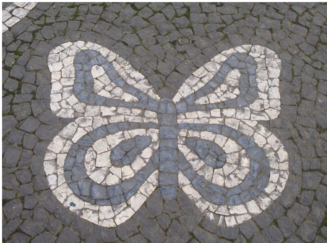
Jardim Duque de Bragança – Angra do Heroísmo