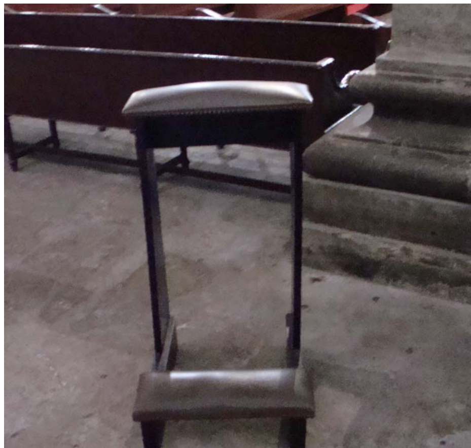
Banco da Igreja da Sé – Angra do Heroísmo