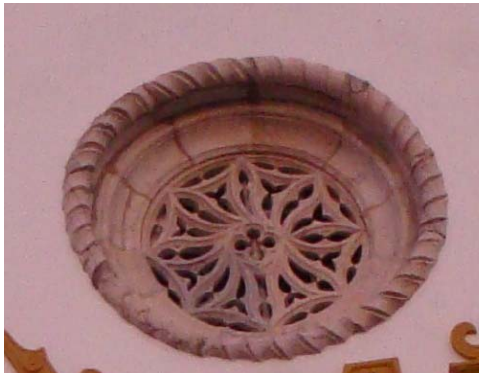
Rosácea da Matriz da Praia da Vitória