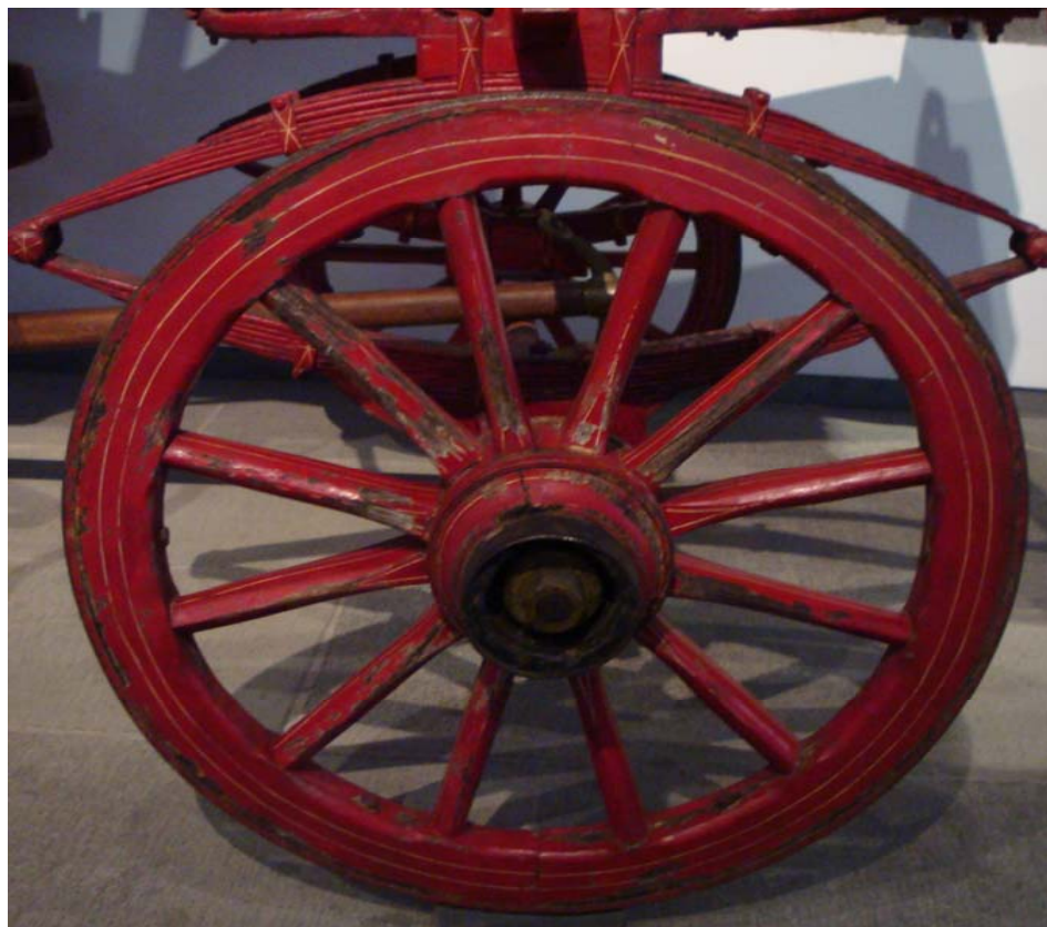
Museu de Angra do Heroísmo