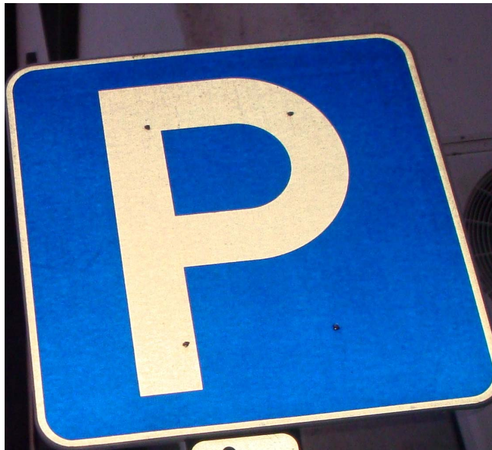
Praia da Vitória