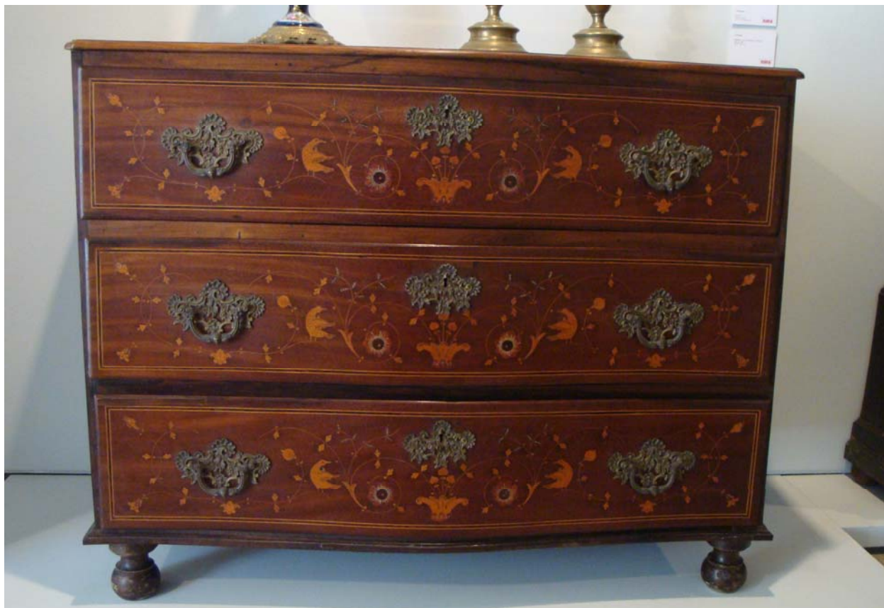
Cómoda do Museu – Angra do Heroísmo D1 → 360/1=360