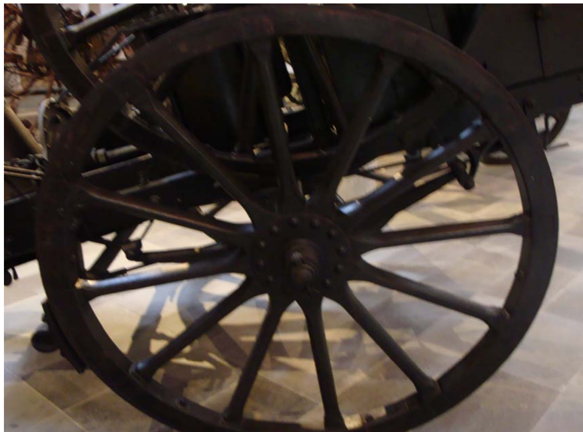
Museu de Angra do Heroísmo