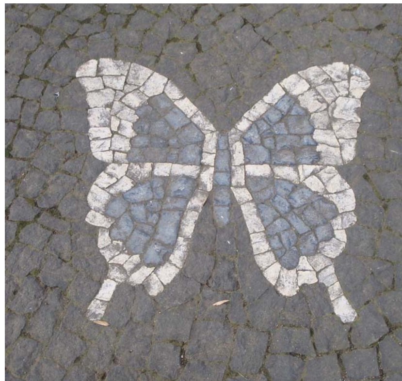
Jardim Duque de Bragança – Angra do Heroísmo