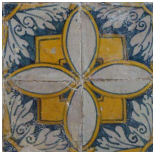
Museu de Angra do Heroísmo