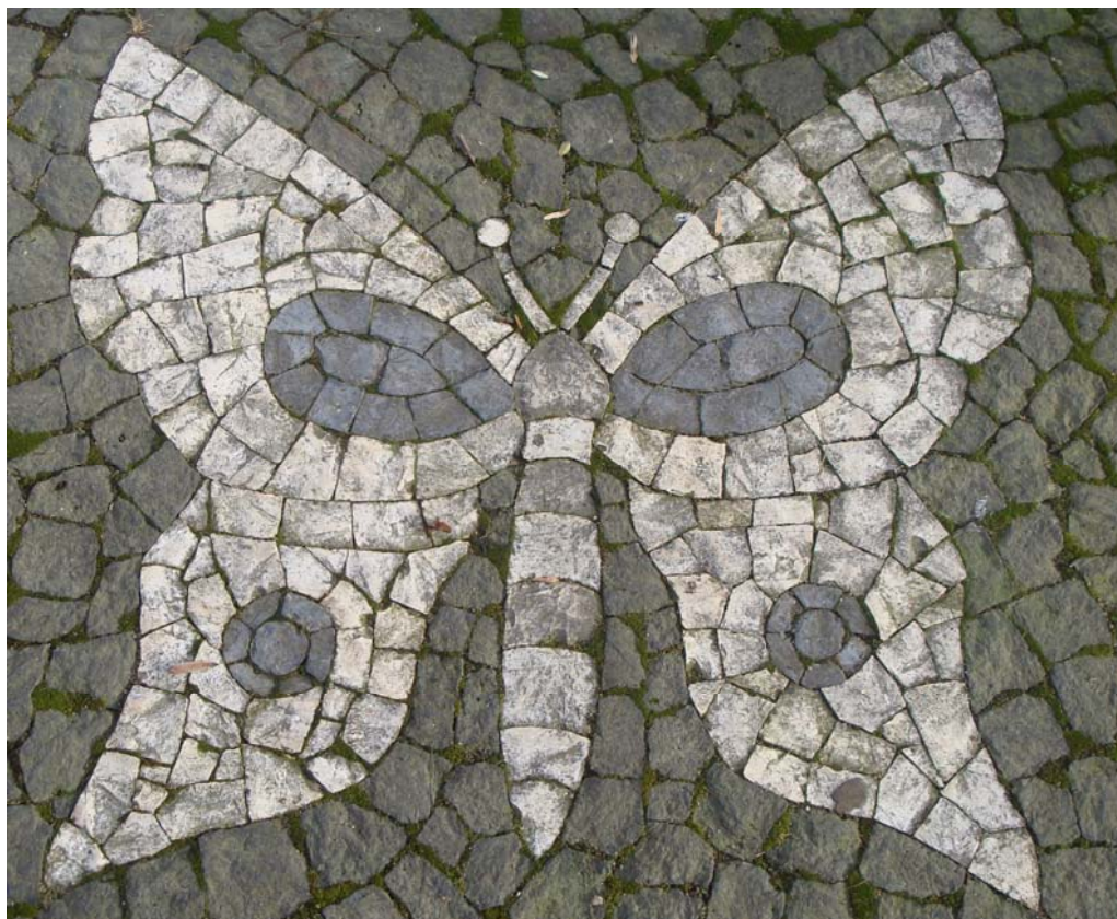
Jardim Duque de Bragança – Angra do Heroísmo