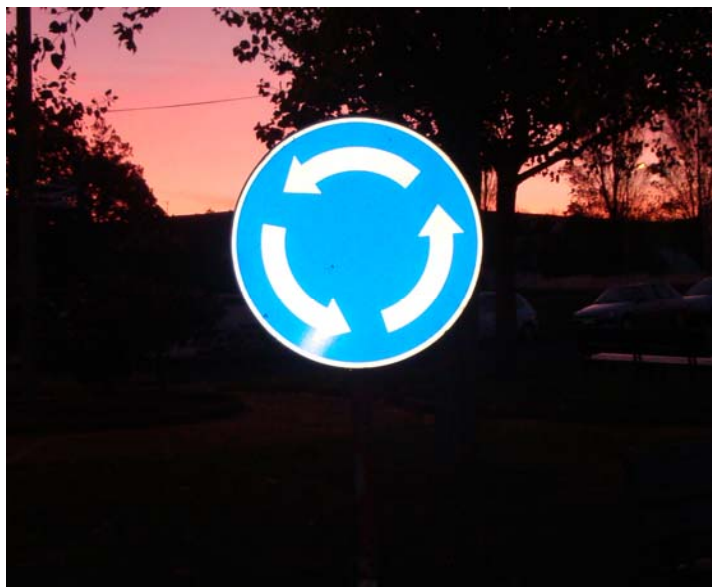
Rotunda na Praia da Vitória